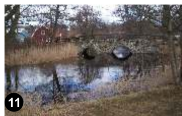
11. Gammal vacker valvbro