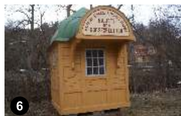
6. Biljettkiosk från Krösnabanan