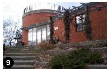
9. Glastornet. Glashytta och försäljning i Nättraby gamla vattentorn, 0455-477 57, Ekbacksvägen 10